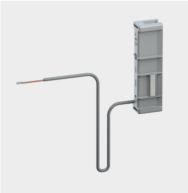
2 Afbeelding Kontaktschakelaar T-RSK MV/UMV MT VDS-C

Voor gebouwen controle- en/of alarmtechniek.