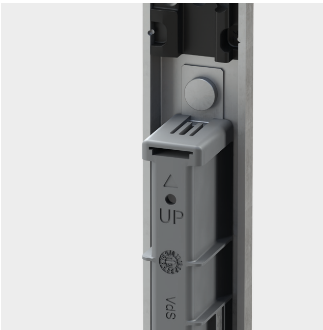
4 Afbeelding Kunststof sluitkom met ingebouwd schakelkontakt